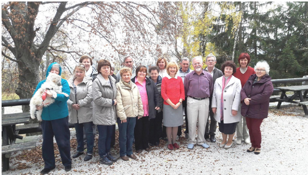
Participantes del Seminario realizado en Planinka, durante la Escuela de Otoño, Slovenia, en las Montañas Pohorhje.