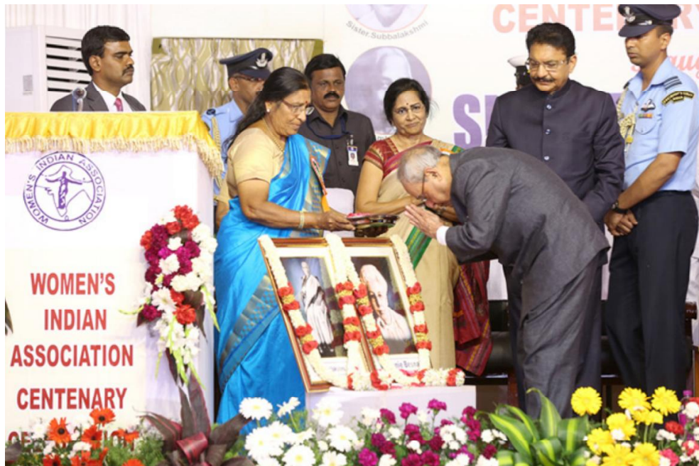
El Presidente de India ofreciendo un tributo de flores enfrente del portarretrato de la Dra. Annie Besant. Ella fue la segunda Presidenta Internacional de la ST y co-fundadora de la WIA en 1917.