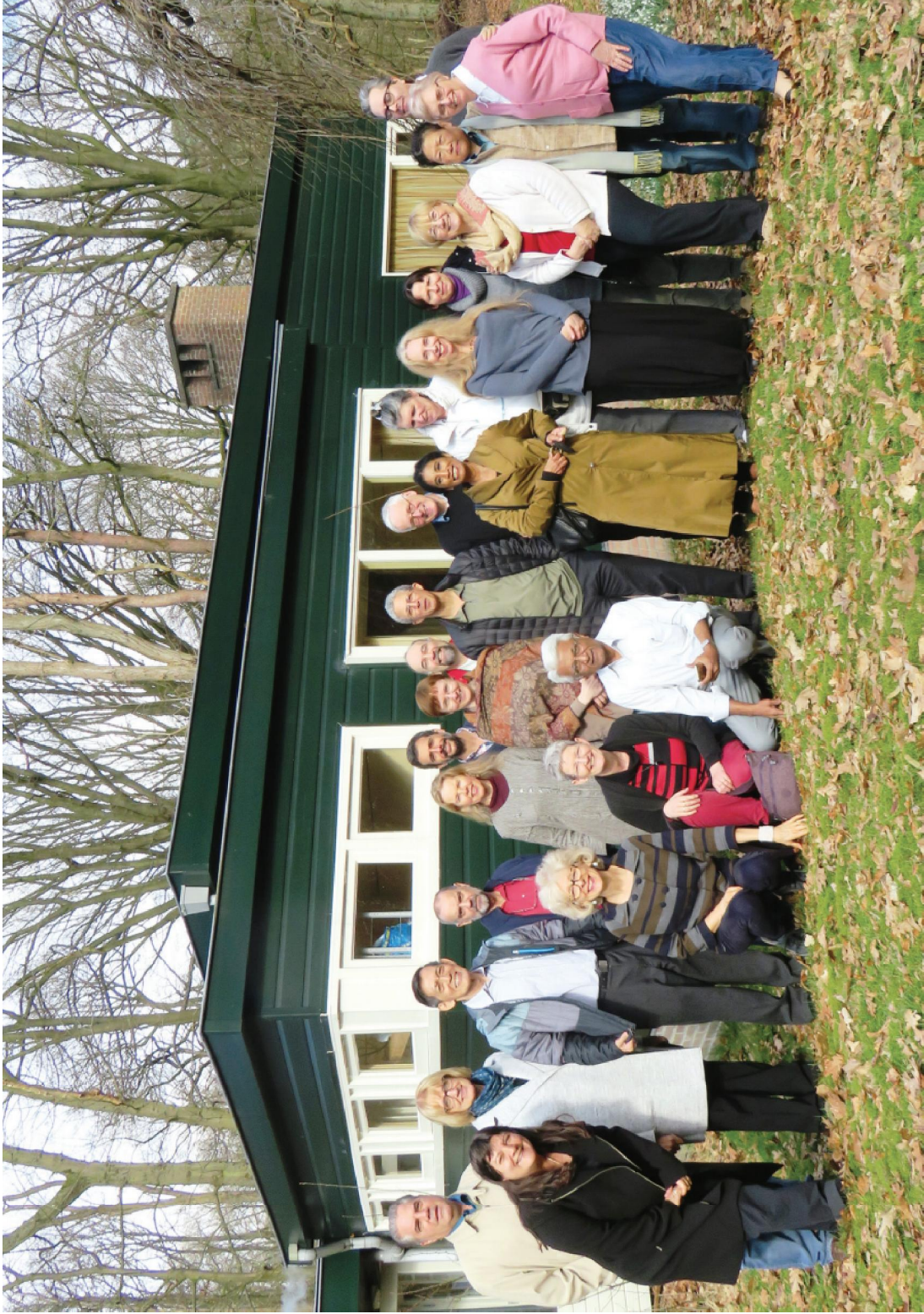
Veintiún líderes de la Sociedad Teosófica (ST) de todo el mundo, incluyendo el decimotercer Consejo General de miembros, reunidos en el Centro Teosófico Internacional (CTI) en Naarden, Países Bajos, desde el 4 al 8 de marzo de 2017 para idear y planificar el futuro de la ST. El Presidente Internacional, Sr. Tim Boyd, parado en el centro (con un saco negro abierto)